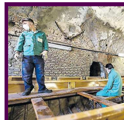
Gli "Scugnizzi a Vela" al lavoro

Talvolta al timone ci saranno anche figure dello sport, della cul-