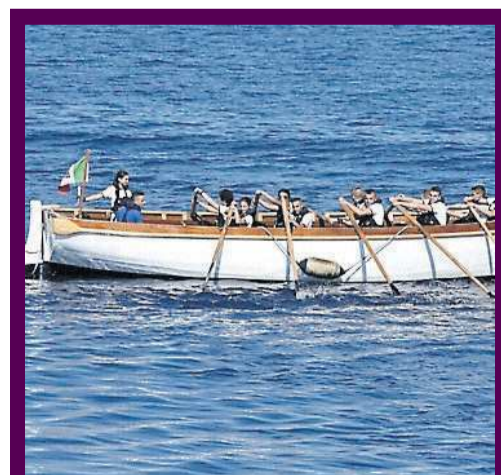
La scialuppa di salvataggio della Vespucci

Nel dicembre 2024, gli Scugnizzi a Vela avevano già restituito a Napoli la Croce di Cariatidi, lo storico ex-voto ligneo eretto per invocare la fine della devastante epidemia di colera che flagellò la città tra il 1836 e il 1837. Il restauro aveva visto i giovani impegnati in un meticoloso lavoro di recupero: furono rimossi gli strati di vecchia vernice e le parti rovinate. Utilizzando esclusivamente scalpelli, gli Scugnizzi avevano poi riportato alla luce l'anima lignea originale del manufatto. Un'iniziativa dallo straordinario valo-