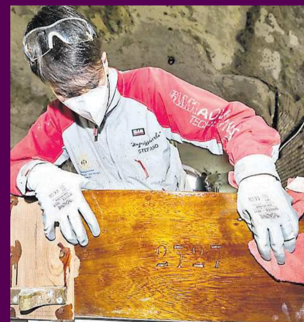
Gli "Scugnizzi a Vela" restaurano la scialuppa dello storico veliero Amerigo Vespucci. L'obiettivo è farne un simbolo di riscatto sociale in vista della Coppa America che porterà Napoli al centro della vela mondiale tra il 2026 e il 2027